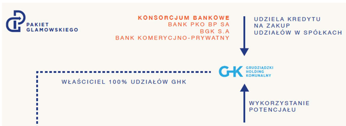
Rys. Fragment jednego ze slajdów „Pakietu Glamowskiego”

Co oznacza określenie BANKU KOMERCYJNO-PRYWATNEGO ?